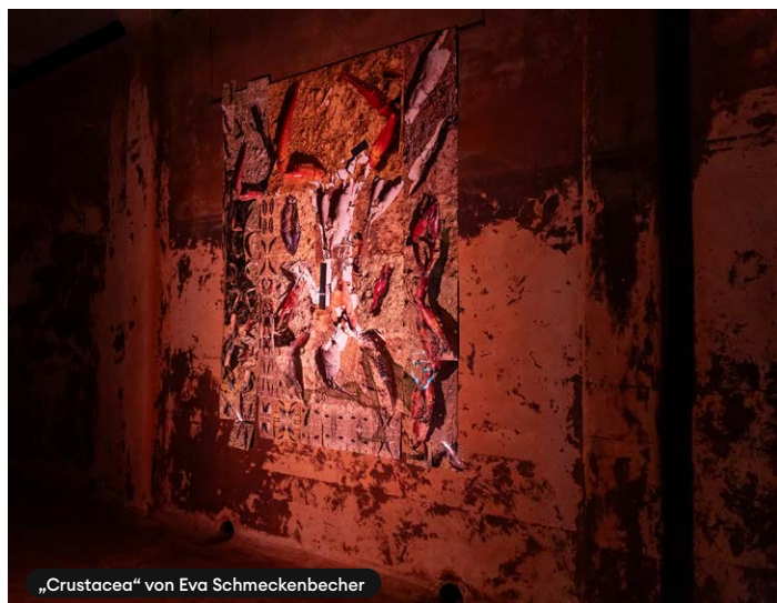
„Crustacea“ von Eva Schmeckenbecher

Es stehen vor Ort keine gesonderten Parkmöglichkeiten zur Verfügung. Wir bitten daher um die Nutzung alternativer Verkehrsmittel.