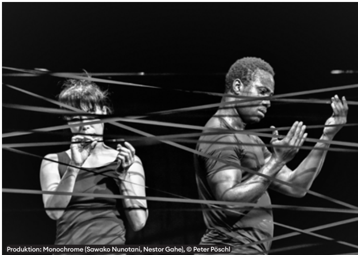
Produktion: Monochrome (Sawako Nunotani, Nestor Gahe)

INTERVENTIONEN 2020 wird unterstützt durch den Kultur Sommer 2020 des Ministeriums für Wissenschaft, Forschung und Kunst des Landes Baden-Württemberg und der Stadt Stuttgart.