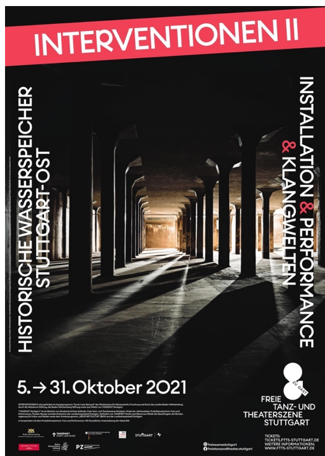
Location: Wasserspeicher | Hochbehälter, Kanonenweg | Stuttgart-Ost. Mit freundlicher Genehmigung der NWS Grundstücksmanagement GmbH & Co. KG und der Netze BW Wasser GmbH

Wir bitten hierbei um vorherige Anmeldung per E-Mail an presse@ftts-stuttgart.de .